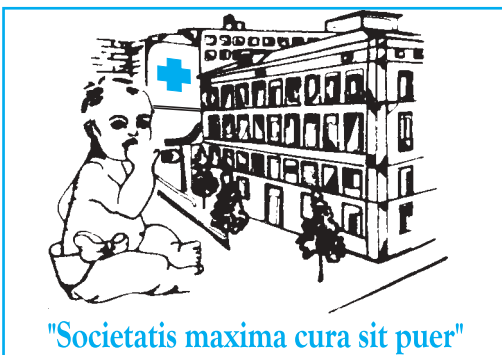
"Societatis maxima cura sit puer"