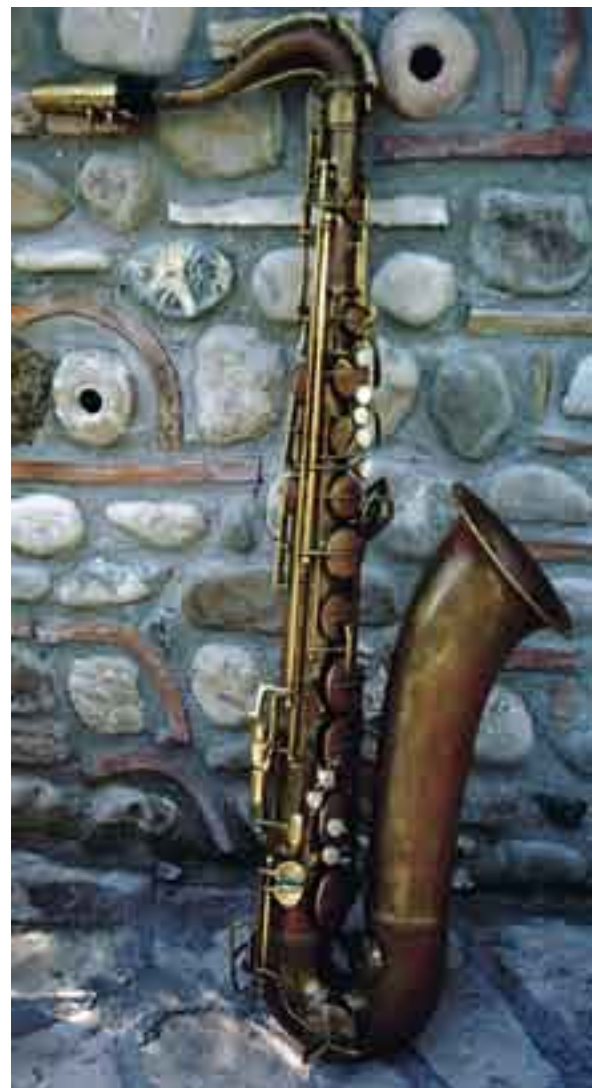
Benevento, Sax americano del 1942 su muro longobardo- Alfredo Bojano

Il FEV 1 è un indice importante e altamente riproducibile della spirometria, ma non riflettendo quella porzione della curva influenzata maggiormente dall'elasticità polmonare (sforzo-indipendente), può capitare che in alcuni casi non sia di grande aiuto nel monitoraggio della malattia asmatica. I flussi parziali, soprattutto il FEF 50 6 ed il FEF 25-75 rappresentano un ausilio importante in alcuni casi di asma. Questi